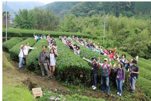
茶畑での記念撮影