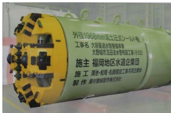
地中を掘削するシールドマシン