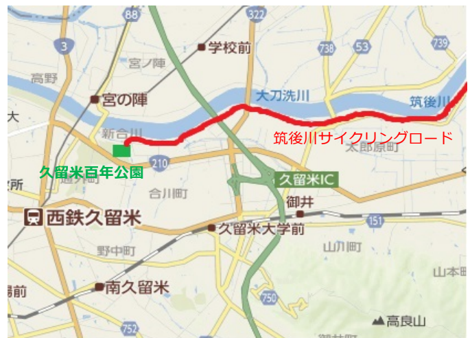
新緑の筑後川サイクリングロード