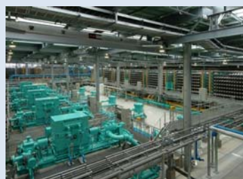
海水淡水化センター施設内部