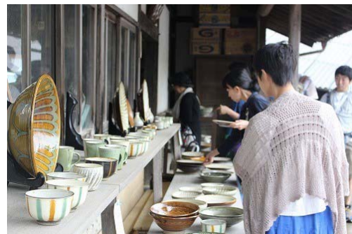
静かな里に響く「ぎぎい〜、ごっとな」という唐臼の音