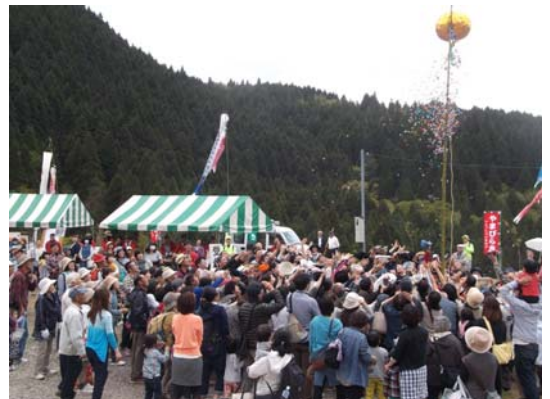
多くの来場者で賑わう山開き会場