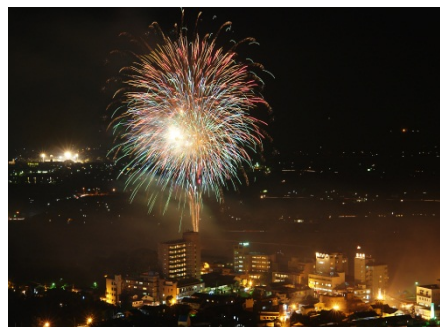
原鶴温泉川開き花火大会