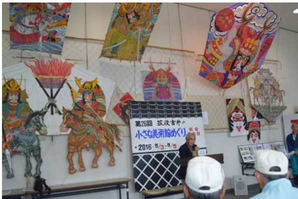
創作和風が展示される白壁ホールでの開会式

日 時 平成 29 年 5 月 3 日（水・祝）～5 月 5 日（金・祝） 10：00～17：00 開催場所 うきは市吉井町内約 30 ヶ所（入場無料） 問い合わせ先 うきは市観光協会 TEL 0943-76-3980