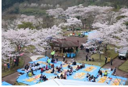
桜が満開の交流会場