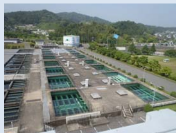
牛頸浄水場急速ろ過池