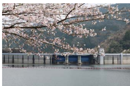
下釜ダム(蜂ノ巣湖)

この行事を通じて、より一層の上下流住民の親睦が深められたと思います。 <総務課 田子森>