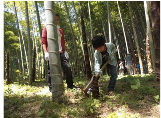
タケノコ掘りの様子