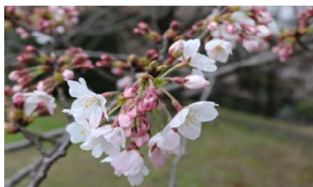
色あざやかに咲く桜