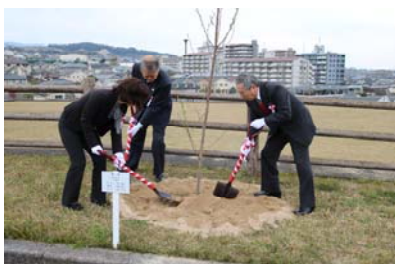
桜を植樹する地域の代表の方々