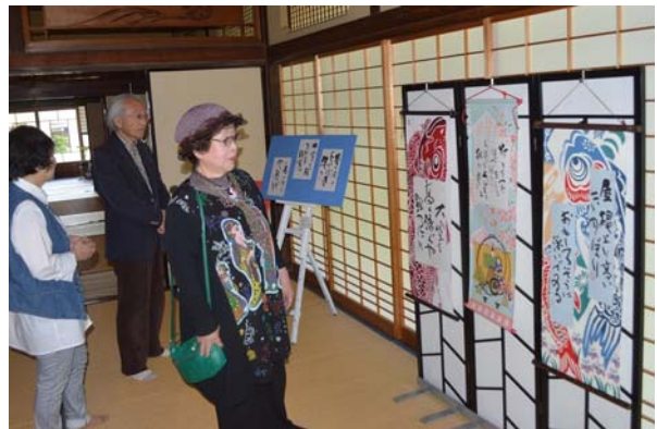
古民家での作品の展示風景