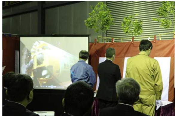
シールドマシン発進式の様子