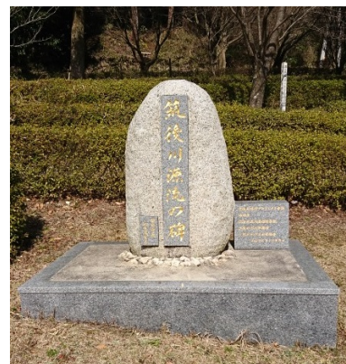
筑後川源流の碑(高取山公園)

めがね橋の近くには駐車場が設けられており、上流側約 1 km のところにある高取山公園には平成 26 年 12 月に「筑後川源流の碑」も建てられました。