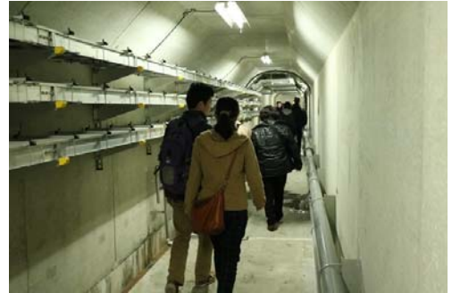
大山ダム内部の監査廊の見学