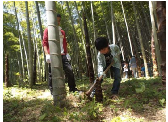
タケノコ掘りの様子