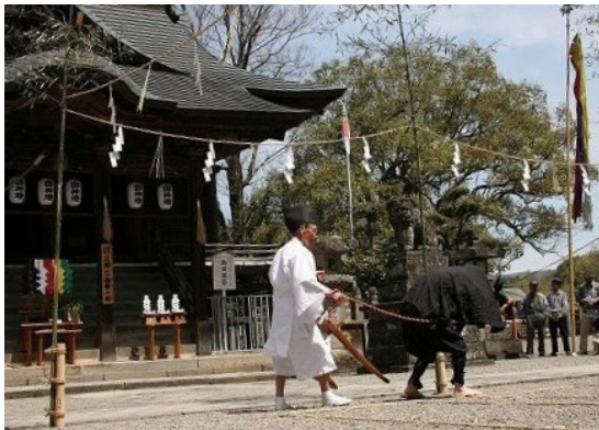
牛と牛使いのユーモラスな掛け合い