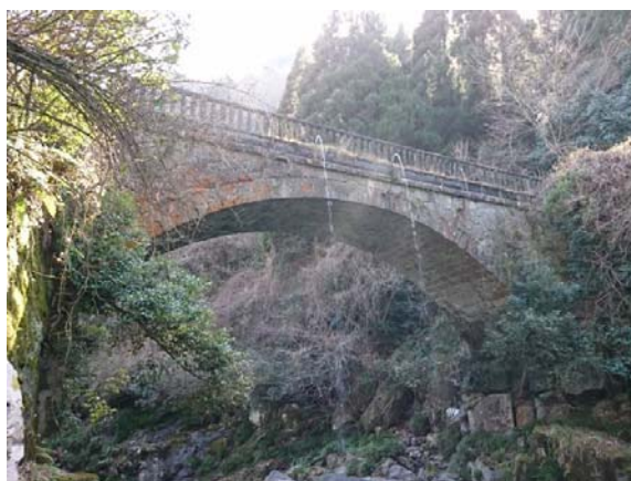
城原川に架かるめがね橋