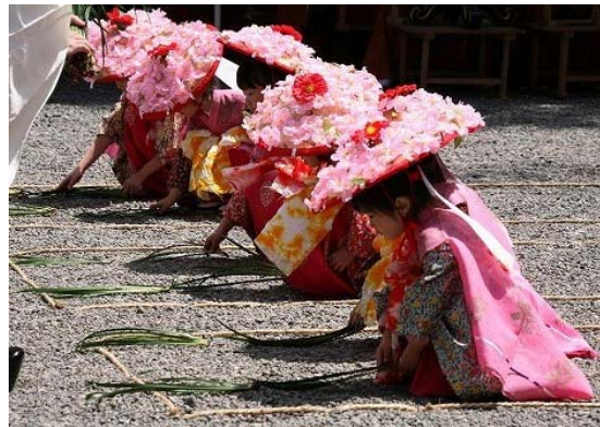
幼い早乙女たちによる田植え