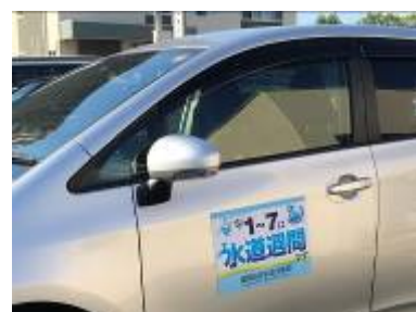
マグネットステッカー

当企業団では、今回の水道週間を機に、自動車用マグネットステッカー、のぼり旗、PR 用ティッシュを作成し、大野城市と共催で PR 活動を行いました。今後とも構成団体の広報活動に協力してまいりますので、イベント等の企画がございましたらお気軽にご相談ください。 <総務課 中川>