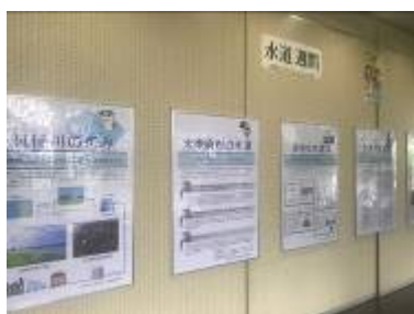
太宰府市役所でのパネル展示