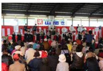
日隈小学校金管バンドの演奏