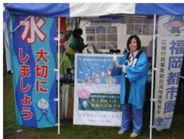
粕屋町上下水道課PRコーナー