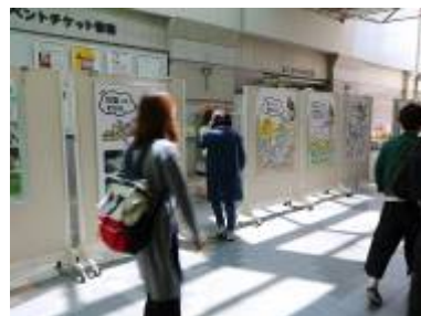
まどかぴあでのパネル展示 (大野城市 ※当企業団と共催)