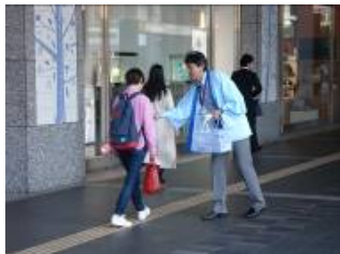
博多駅前ほかでの PR (福岡市)

水道週間は、厚生労働省、地方公共団体の水道事業体等によって実施される様々な広報活動等を通して、国民各層に対して、水道の現状や課題について理解を深め、今後の水道事業の取組について協力を得ることを目的として、毎年 6 月 1 日～7 日に実施されています。60 回目を迎える今回についても、構成団体において、下記をはじめとする様々な取り組みが行われました。