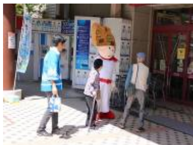
イオン大野城 SC 前での PR (大野城市 ※当企業団と共催)