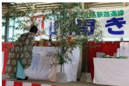
山の安全を祈願する神事