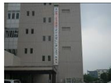
糸島市役所の懸垂幕

当企業団では、今回の水道週間を機に、自動車用マグネットステッカー、のぼり旗、PR 用ティッシュを作成し、大野城市と共催で PR 活動を行いました。今後とも構成団体の広報活動に協力してまいりますので、イベント等の企画がございましたらお気軽にご相談ください。 <総務課 中川>