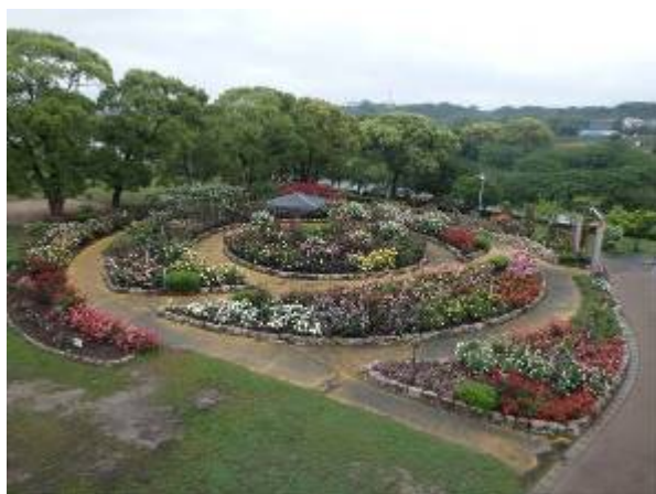
駕与丁公園の花壇