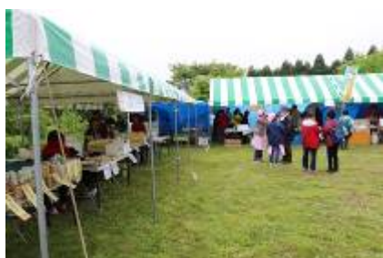
山開き会場の出店

また、当企業団は、今回の行事を記念してコナラの植樹を行いました。 <総務課 田子森>