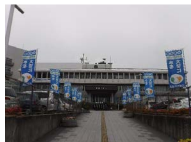
古賀市役所前でののぼり旗