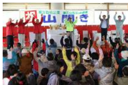
副企業長の音頭による万歳