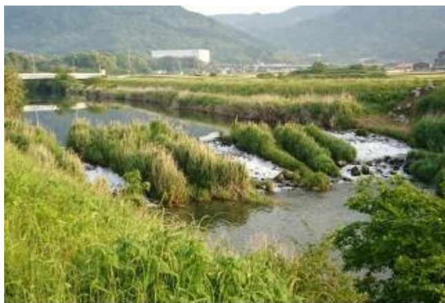
水のがしが設けられた三千石堰