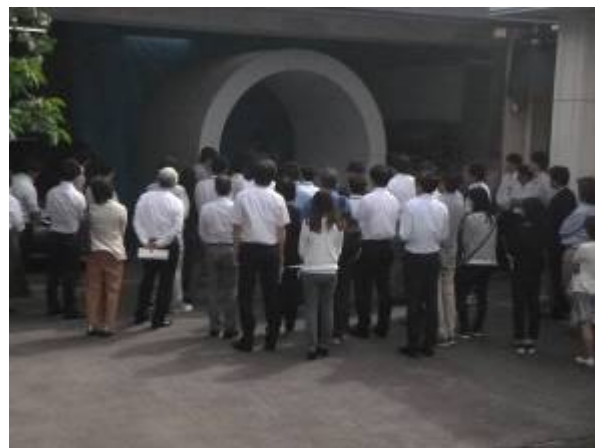
福岡導水の導水管模型