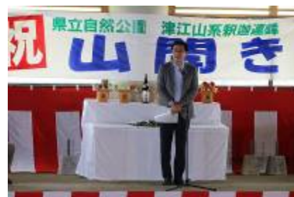
日田市長の来賓あいさつ