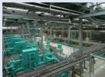
海水淡水化センター施設内部