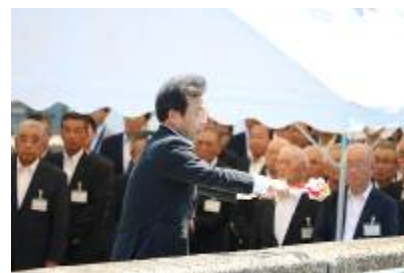
企業長の清酒注ぎ