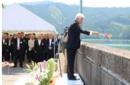
朝倉市長の清酒注ぎ