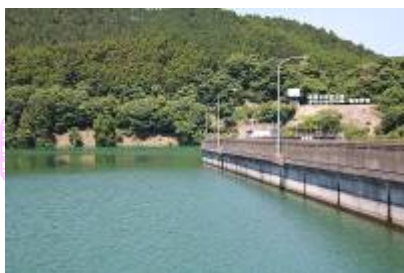
ほぼ満水の江川ダム