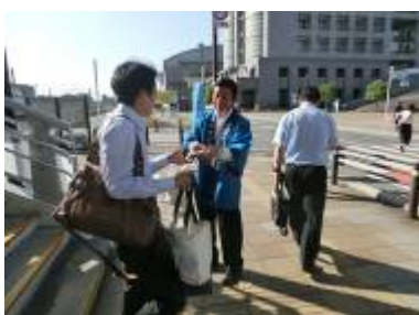
JR 春日駅前ほかでの PR (春日那珂川水道企業団)