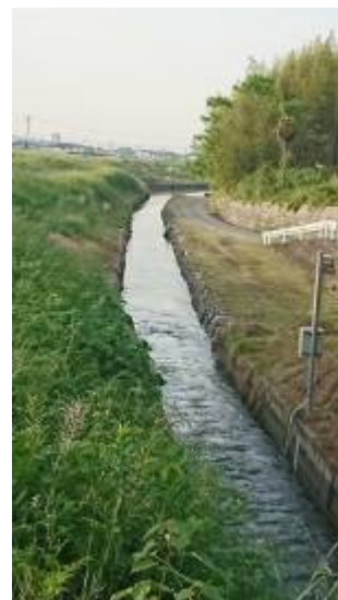
三千石堰横の横落水路