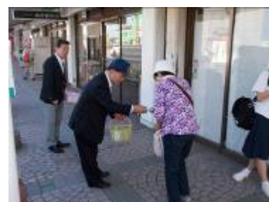
JR 二日市駅前ほかでの PR (筑紫野市)