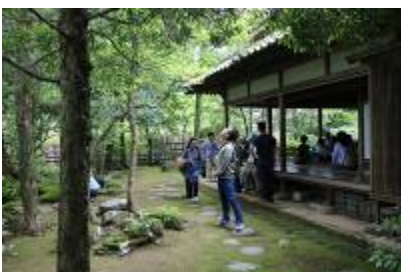
楠森川北家の見学