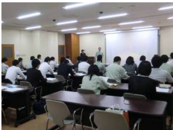
各所属による業務説明