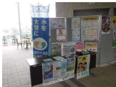
古賀市役所口ビーでの PR