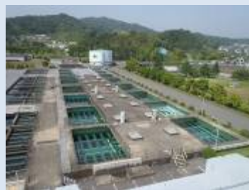
牛頸浄水場急速ろ過池