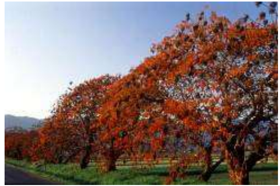
燃えるような紅葉が美しい櫨並木

期間中、沿道には野菜・果物など地元の特産物や、和ろうそくなどハゼ関連商品を販売する店で賑わいます。