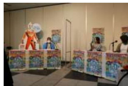
アイアンキングとYoutubeに出演