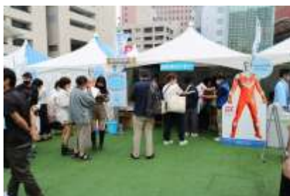
大人気の利き水コーナー