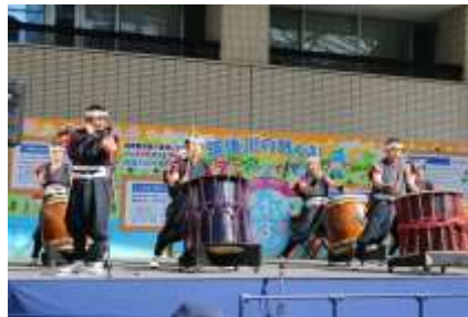
イベントステージ