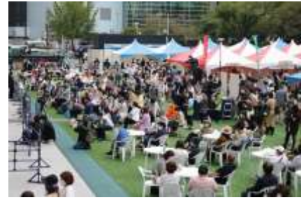
ステージを楽しむ来場者