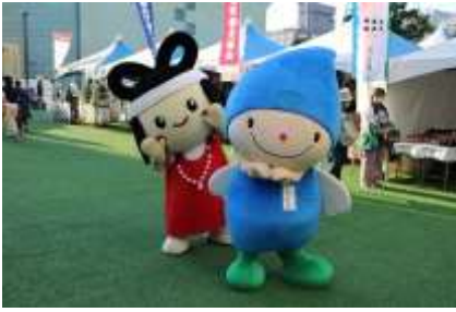
ちっこりん (前:都市圏組合) と 卑弥呼ちゃん (後:朝倉市)