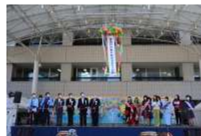
オープニングのくす玉割り

会場内では、来場者と筑後川流域のマスコットキャラクターの交流やテレビの生中継取材、Youtubeでのイベント中継などもありました。