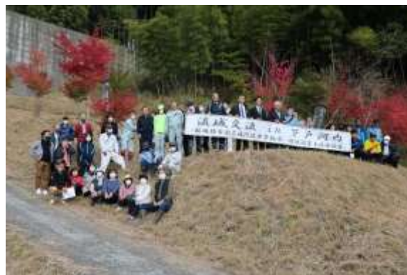
参加者記念撮影 (令和3年度)