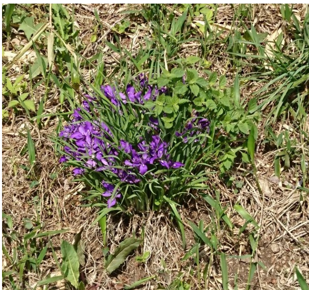
可憐なエヒメアヤメ