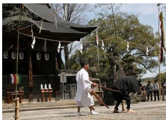
牛と牛使いのユーモラスな掛け合い

まず、宮司が祝詞を奏上し、縄を張って水田に見立てた境内で、神主が五色の御幣をかざして太陽の恵みが田に与えられるよう祈願し、氏子2人が牛使いと牛に扮して、田を耕す場面を演じます。牛の疲れた様子や牛使いとのユーモラスな掛け合いが見物客の笑いを誘う楽しいお祭りです。