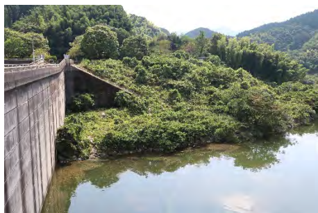
堤体右岸のロックフィル部分 （木々が茂っている）

山神ダムの水は、2 kmほど下流にある山神水道企業団の浄水場で処理され、筑紫野市・太宰府市・ みい 三井水道企業団に送水されています。