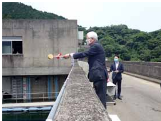
清酒注ぎの儀(令和2年度)