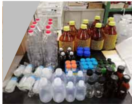
全項目検査の採水容器(12 種類)