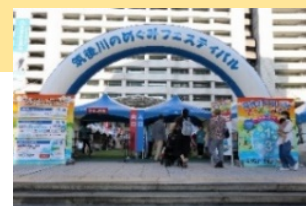
前回の「筑後川のめぐみフェスティバル」