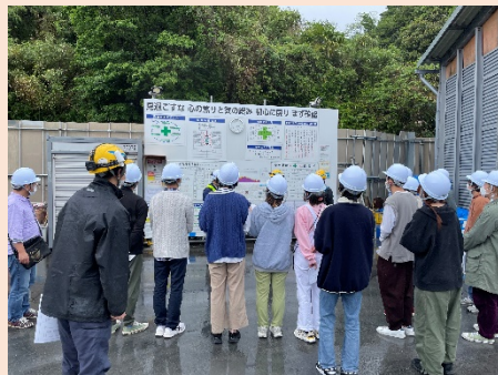
※ 取材した様子 (5月13日撮影)

本事業について、広報・周知いただきたく、制作過程も含め取材よろしくお願いたします。