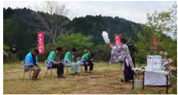
山の安全を祈願する神事の様子