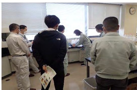
<水質センター 石井>