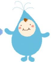
企業団キャラクター ビュータくん

この「ふくすいき～福水企～」通信は、福岡地区水道企業団、各構成団体などの情報交換のために毎月発行しています。