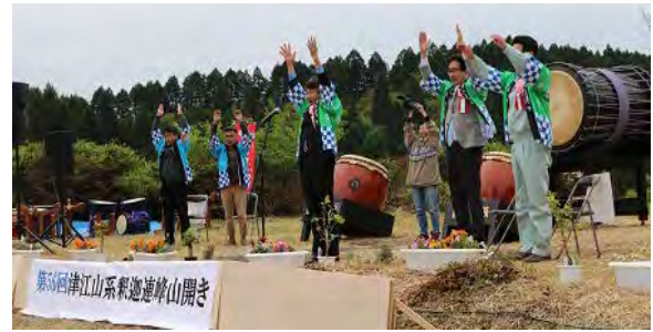
企業長による万歳三唱