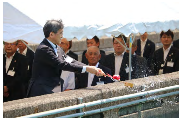
清酒注ぎの儀(令和4年度)