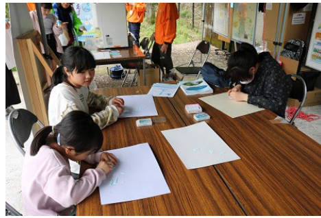
型抜きを楽しむ様子