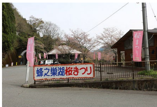
蜂ノ巣湖桜まつり（会場入り口）

今年も桜の開花が早めではありましたが、散る前の桜が美しく、爽やかな日の中でイベントを楽しむことができました。