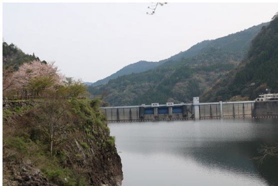
下釜ダム（蜂ノ巣湖）

日田市中津江村の しもうけ 下釜公園で、蜂ノ巣湖桜まつり実行委員会（下釜ダム湖と森の会、国交省筑後川ダム統合管理事務所、中津江むらづくり役場）の主催で蜂ノ巣湖桜まつりが開催されました。当日は、地元の皆さまや国土交通省筑後川ダム統合管理事務所、福岡市水道局、当企業団職員などが参加しました。