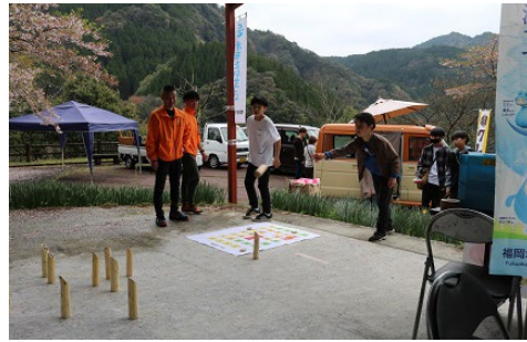
モルックを楽しむ様子