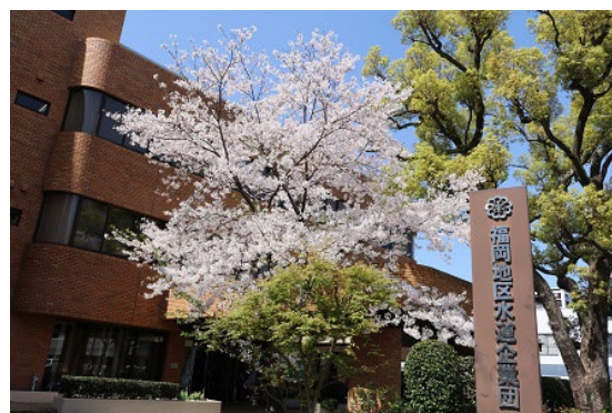
企業団玄関の桜（4月1日撮影）

皆さんも新しい環境で、気持ちを新たに様々なチャレンジを開始していることと思います。