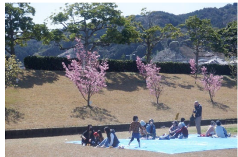
当日の会場の様子