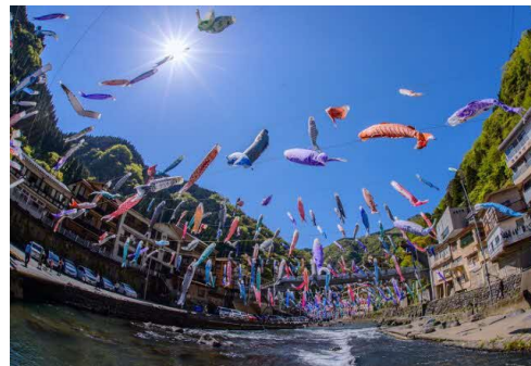
川の上空を泳ぐ鯉のぼり