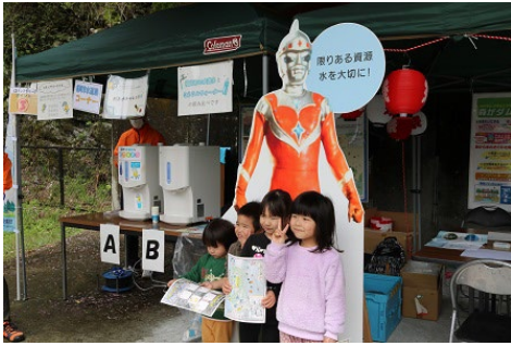
アイアンキングは子供たちの人気者