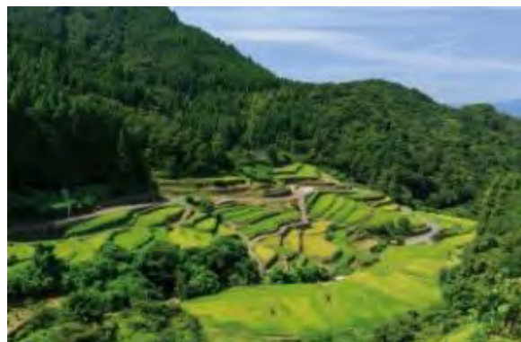
日本棚田百選に選ばれた『つづら棚田』

筑後川のめぐみや自然環境を守る大切さを学んでいただくとともに、福岡都市圏の水源地である「うきは市」の豊かな魅力を感じていただけるのではないのでしょうか。