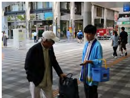
インターンシップの高校生も参加