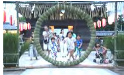
茅の輪くぐりの様子