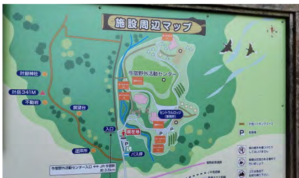
施設周辺のマップも充実