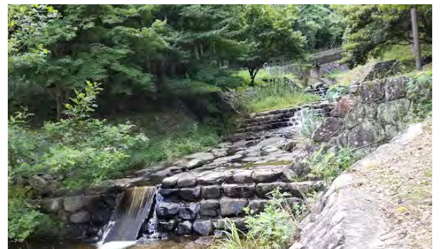
石の滑り台や石段を流れる綺麗な水