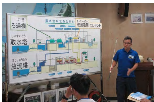
北谷浄水場（海水淡水化センター）の視察

総会 2 日目には、 おきなわけん なかがみくん ちやたんちやう 沖縄県 中頭郡 北谷町 にある北谷浄水場（海水淡水化センター）等で、硬度が高い原水から硬度成分を除去する硬度低減化施設や、当企業団同様の大型海水淡水化施設などの視察が行われました。