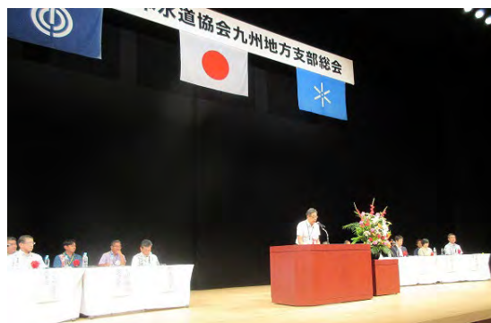
九州地方支部総会の様子

その後、会務報告・令和 5 年度決算・令和 6 年度予算等の議題のほか、会員提出問題の審議が行われました。この会員提出問題は、10 月 9 日～11 日に神戸市にて開催される日本水道協会全国会議に提出されます。