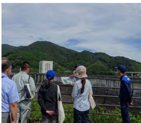
五ヶ山ダムの見学

五ヶ山ダムでは、福岡市の水道事業と五ヶ山ダムの概要についての聴講や動画を視聴して、ダム等の見学をしました。