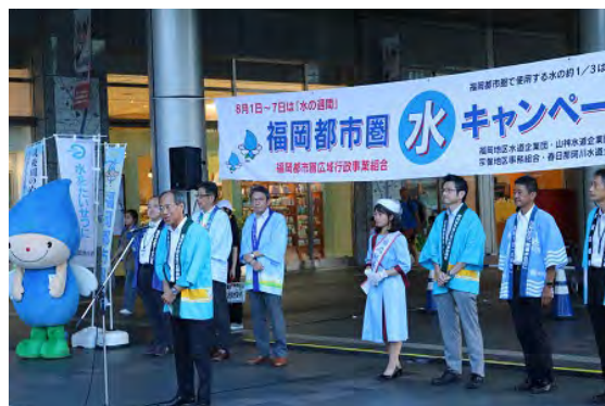
開会式（JR博多駅前広場）

その後、国土交通省九州地方整備局、福岡県、福岡市、福岡市水道サービス公社、当企業団など水道関係者約50人が啓発チラシと有明海産「福岡のり」などを通行する方々に配布し、「水の大切さ」と「筑後川のめぐみ」についてPRを行いました。