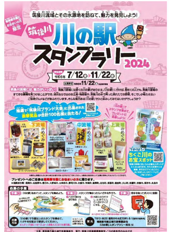
スタンプラリーのリーフレット

※詳細につきましては、 こちら（福岡都市圏広域行政事業組合ホームページ） をご覧ください。