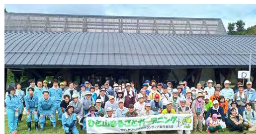
参加者の集合写真

日 程 令和6年9月28日(土) 開催場所 大分県日田市大山町 たらいぼる 田来原美しい森づくり公園、大山ダム