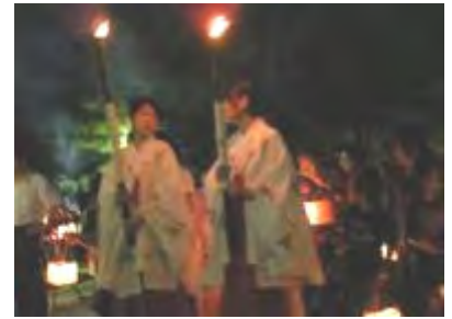
子どもボンボリ行列の様子

問い合わせ先 篠山神社 TEL 0942-33-3030 twitter(@sasayamajinja)