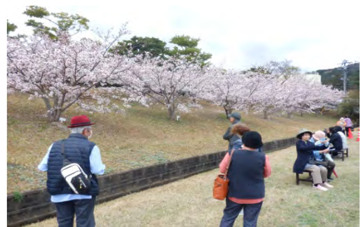
花見を楽しむ地域の方々

牛頸浄水場では、毎年、地域の皆さまをお迎えして『桜花見会』を開催しています。会場の桜はちょうど見頃を迎えており、当日は次第に雨が降る天候となりましたが、多くの方々にご来場いただきました。地域の皆さまからは、「毎年楽しみにしています」「桜がとてもきれいですね」などの温かいお声を頂戴し、地域の皆さまとのつながりを改めて感じる、実りある一日となりました。