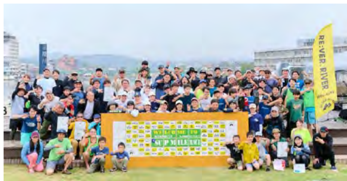
記念写真（令和7年度）

会場周辺では、飲食ブースの出店や日隈小金管バンド・岳滅鬼太鼓の演奏など、観戦以外にも楽しめる催しが盛りだくさんです。心地よい春の休日を三隈川で楽しんでみませんか。