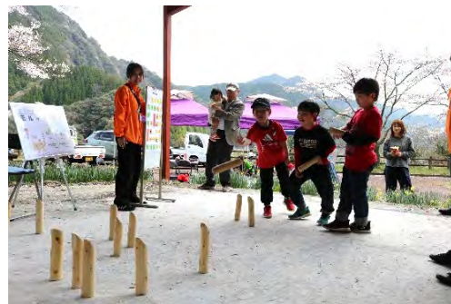
モルックを楽しむ子どもたち