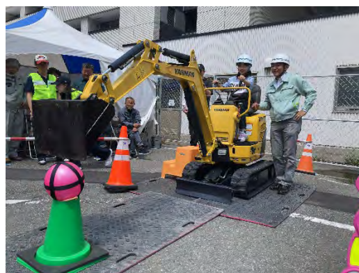
ミニショベルカー操作体験（令和7年度）