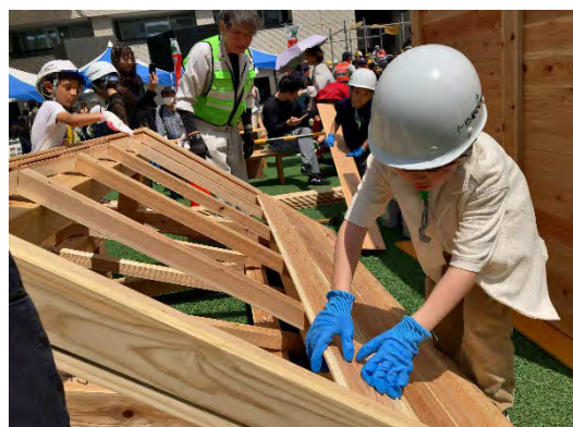
小さな家作り体験（令和7年度）

当企業団も出展し、濁った水が綺麗になる『ろ過実験』や、福岡導水管の大きさを体感できる『水のトンネル』が登場します。会場でしか味わえない体験がそろっていますので、お子様はもちろん、大人の方も一緒に、建設の世界に触れてみてはいかがでしょうか。