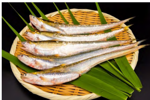
城島で獲れたエツ

日 時 令和8年5月1日（金） 10：00～ エツ感謝祭 開催場所 エツ大師堂（久留米市城島町上青木314-1） 問い合わせ先 エツ感謝祭実行委員会（久留米南部商工会内） TEL 0942-64-3649