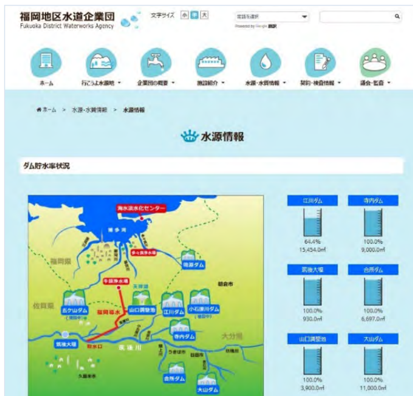
ホームページ画面