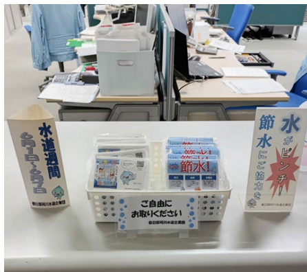
春日那珂川水道企業団庁舎窓口