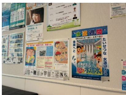
筑紫野市（ポスター）