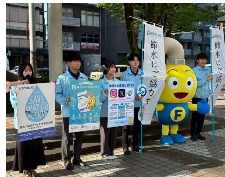
福岡市（アサデス 30 秒 PR）