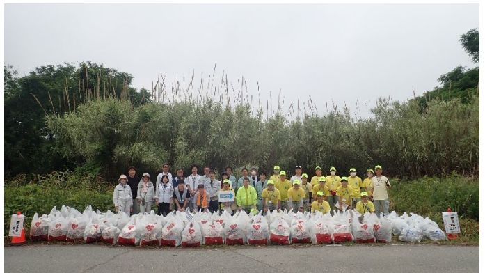
収集したゴミ袋と参加者