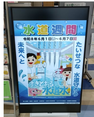
那珂川市役所庁舎内