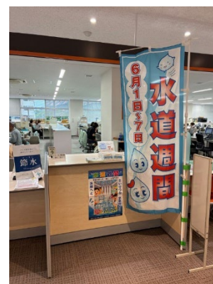
筑紫野市（のぼり等）