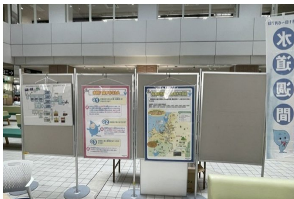
春日市役所 1 階アトリウム