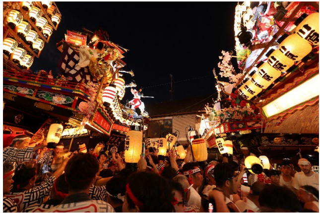
ユネスコ無形文化遺産の日田祇園

夜には数多くの提灯に灯がともり、優雅な『晩山』の巡行で夏の夜を彩ります。ぜひ足を運んでみてはいかがでしょうか。