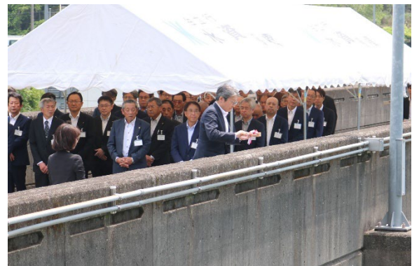
名古屋企業長の清酒注ぎ

夏場の水需要の増加を迎えるにあたり、当企業団も恵みの『水』を大切に運用していきます。