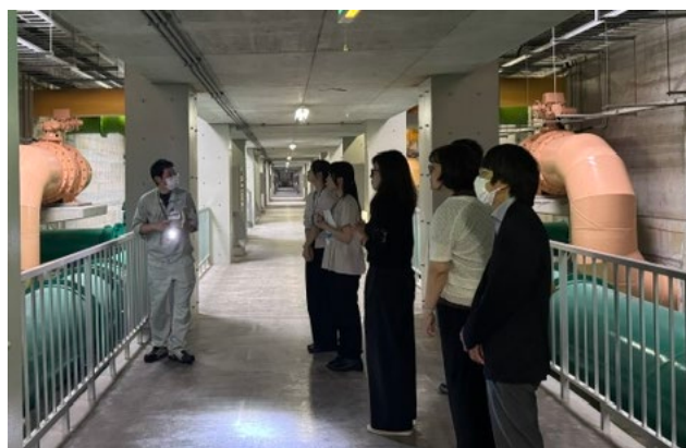
牛頸浄水場での施設見学