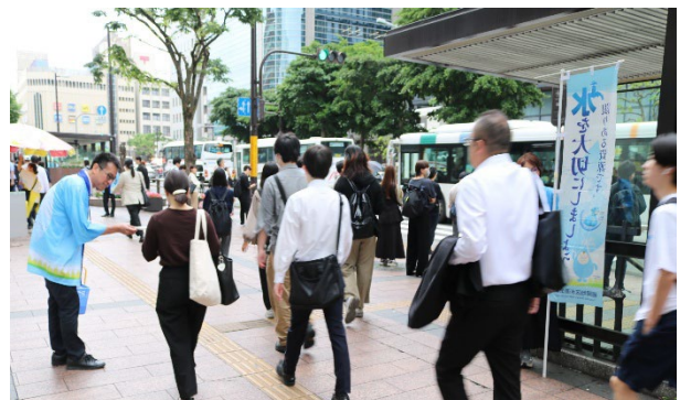
道行く人々に節水を呼びかける当企業団職員