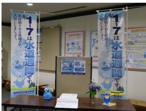
福岡地区水道企業団本庁舎玄関内