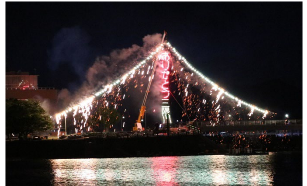
ありがとう三隈川

りがとう三隈川』の文字が浮かび上がる仕掛け花火と打ち上げ花火を実施しました。打ち上げ前には筑後川流域の皆さまへの感謝のメッセージが読み上げられ、次々に咲く花火が日田の夜空を鮮やかに彩り、また、三隈川の水面に反射する色彩が幻想的なひとときを生み出しました。